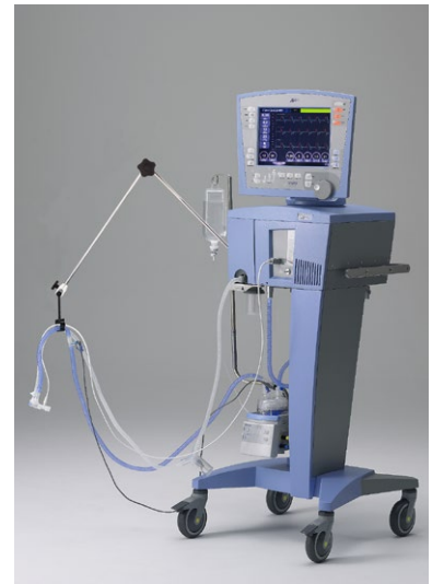
(注1) いずれか1点を選んでください